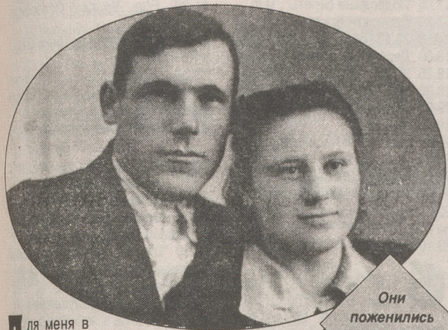
Они поженились полвека назад...

Мой друг, для счастья, Любя, живи, - Найдешь ты счастье В своей любви! И.Гете