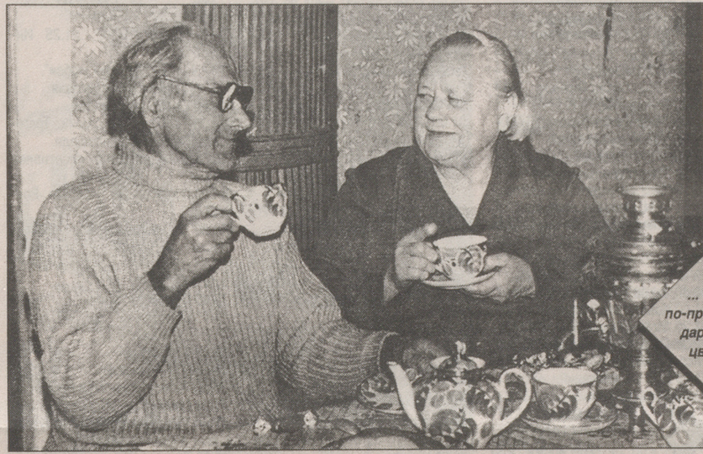
... и он по-прежнему дарит ей цветы